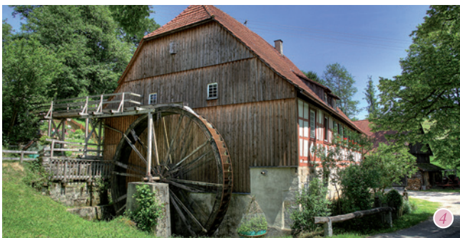
1 – Oberes Schloss, Rathaus 2 – Stephanuskirche // 3 – Hohler Stein 4 – Meuschenmühle